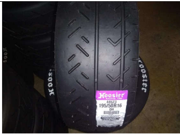
Rallye-Asphalt 15" bis 18" mit E-Kennung