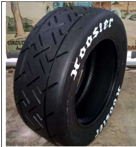
Rallye-Asphalt 13" und 200/580 R 15